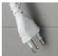
Enchufe 3 polos