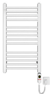
Calentador de toallas