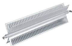
Difusor Térmico Elemento Calefactor