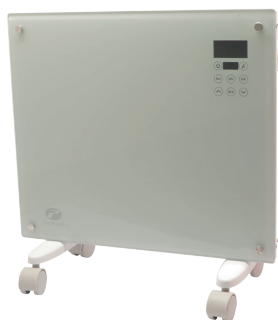
Panel de vidrio blanco